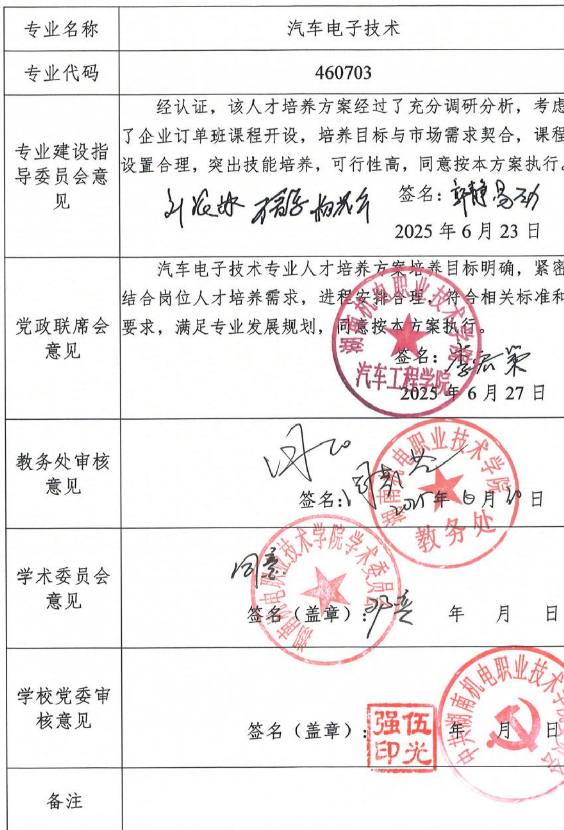
2025 级专业人才培养方案制订与审核表