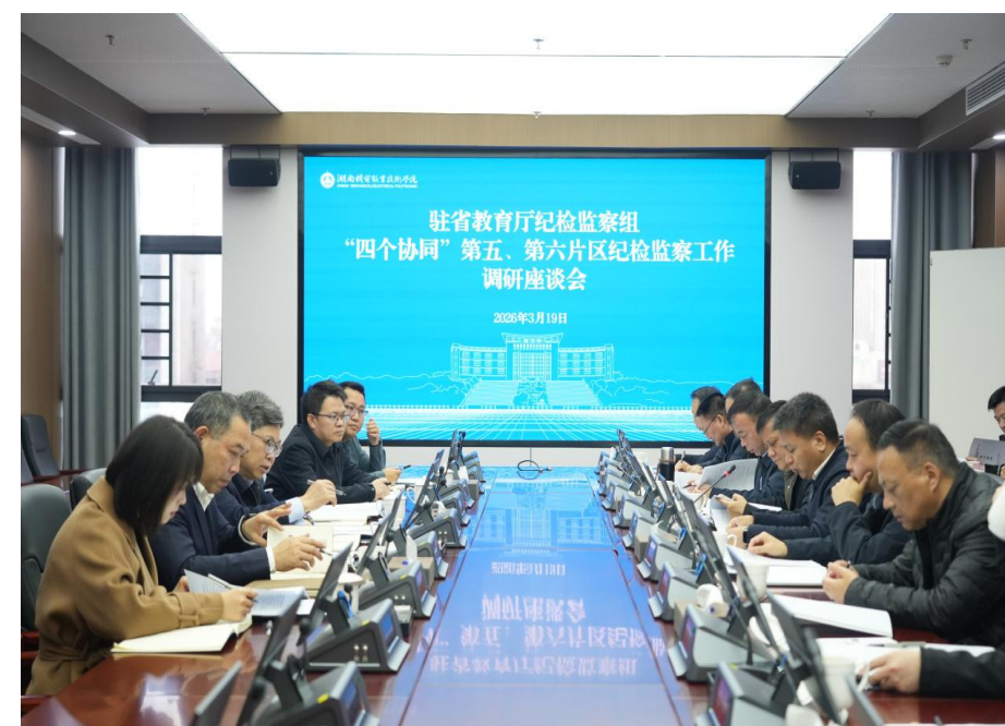
3月19日，省纪委监委驻省教育厅纪检监察组“四个协同”第五、第六片区纪检监察工作调研座谈会在我校召开。