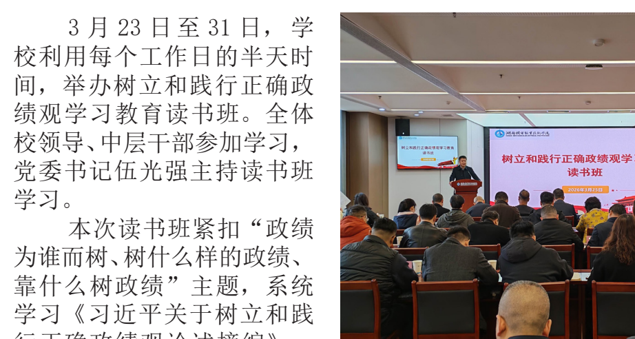
3月23日至31日，学校利用每个工作日的半天时间，举办树立和践行正确政绩观学习教育读书班。